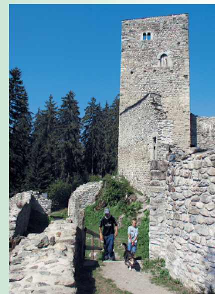
Die letztmals um 1580 bewohnte Burg Jörgenberg zerfiel im Laufe der Jahrhunderte.

► ... die verschiedenen Besitzer waren mit dem Wohnkomfort der Burg unzufrieden, und daher wechselte sie oft die Hand. Anfang des 17. Jahrhunderts wurde die Burg dann aufgegeben.