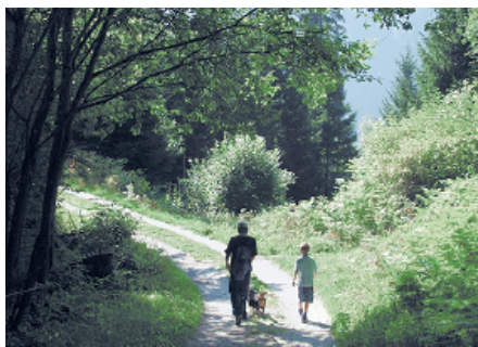
Im Sommer willkommen: schattiger Waldweg zur Ruine Jörgenberg.

Waltensburg – Rueun (Wanderzeit: 1 h 30 min)