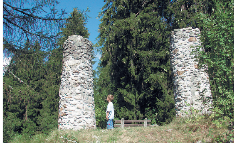
Richtstätte mit zwei Galgensäulen auf dem Munt Sogn Gieri, ganz in der Nähe der Burg.

Ferienregion Brigels, Tel. 081 941 13 31, www.brigels.ch