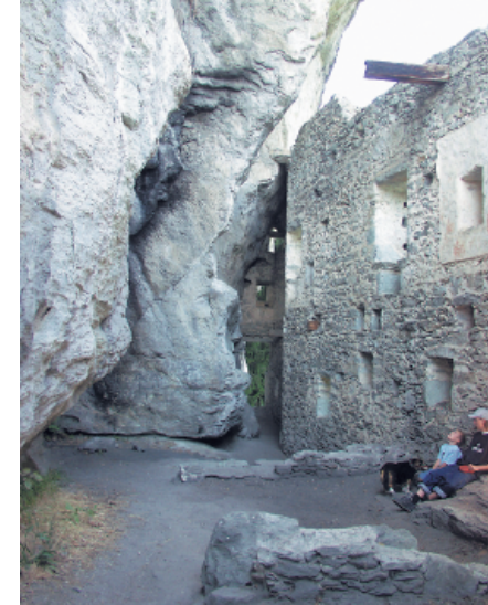
Ungewöhnlich: Die Burg Kropfenstein wurde an eine überhängende Felswand gebaut.

in die Surselva zu einer ganz ähnlichen Burg.