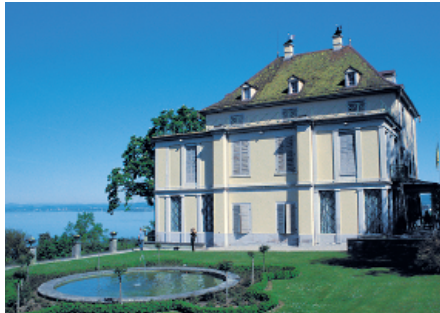
Napoleons III. Heimat: Schloss Arenenberg.

Mannenbach – Ermatingen (Wanderzeit: 2 h)