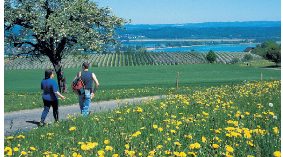
Im Frühjahr ist die Wanderung am Seerücken besonders lohnend.

Schloss Arenenberg, Tel. 071 663 32 60, www.napoleonmuseum.ch