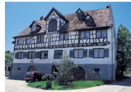
Schloss Hueb: ein Landwirtschaftsbetrieb.