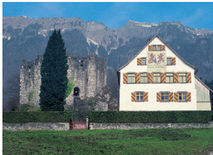
Das alte Zeughaus der Zürcher Vögte steht seit 1625 neben der Ruine Forstegg.

Bad Forstegg – Mauren (Wanderzeit: 3 h 30 min)