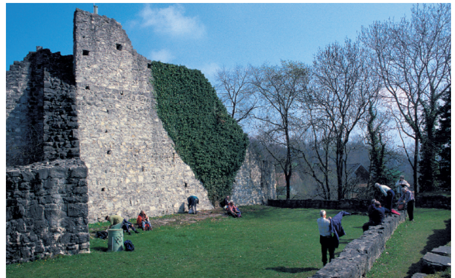
Die Ruine Neu-Schellenberg wurde vom historischen Verein mustergültig renoviert.

Liechtenstein Tourismus, Tel. 00423 239 63 00, www.tourismus.li