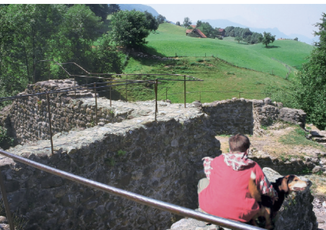
Die Ruine der Gesslerburg wurde wegen den vielen Besuchern mit Geländern ausgestattet.

Unsere heutige Wanderung führt ins Herz der Schweiz an einen der wichtigsten Schauplätze unserer Geschichte. Zwischen Zuger- und Vierwaldstättersee soll Wilhelm