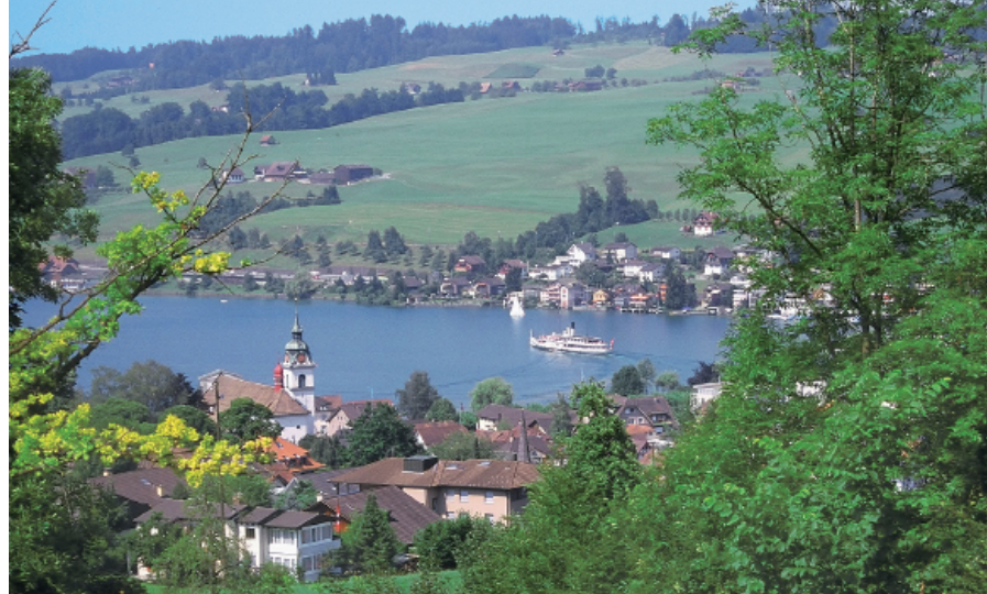
Blick von der Gesslerburg auf Küssnacht. Auf dem See: einer von fünf Raddampfern.

Weitere Informationen: Tourist-Info Küssnacht, Tel. 041 850 33 30, www.kuessnacht-tourismus.ch