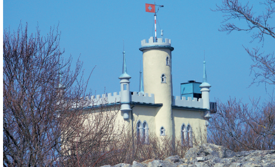
Als wäre es aus dem Legoland: das Sälischlössli gegenüber der Ruine Wartburg.

Gemeinde Aarburg, Tel. 062 787 14 14, www.aarburg.ch