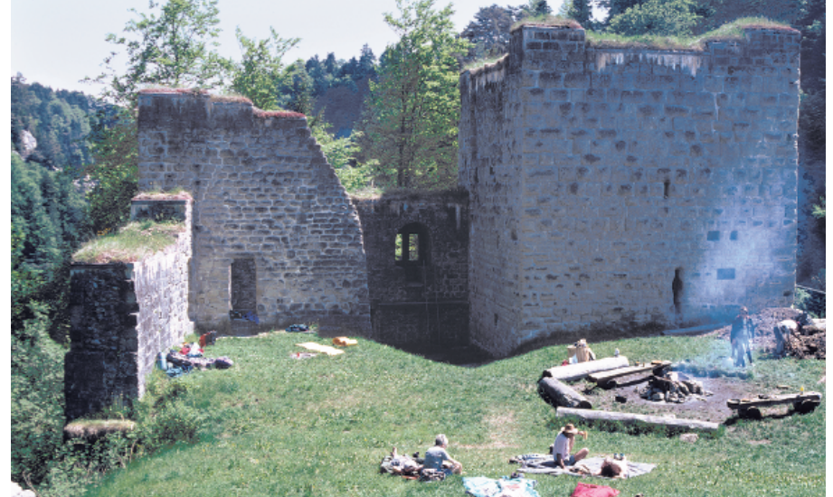
Die Anlage der Grasburg wird heute von dichtem Gebüsch und Wäldern umwuchert.

Verkehrsbüro, Tel. 031 731 13 91, www.schwarzenburgerland.ch