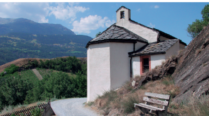
Zwischen St-German und Raron kommen wir an der male-ruischen Kapelle St. Anna vorbei.

Auf einem schroffen Felskopf, der sich unterhalb der Lötschberg-Südrampe jäh über dem Dorf Raron erhebt, hat der berühmte Dichter Rainer Maria Rilke (1875–1926) seine letzte Ruhe gefunden. Sein Grab befindet sich unmittelbar an der Mauer der katholischen Pfarrkirche St. Romanus. Gleich daneben können wir in der