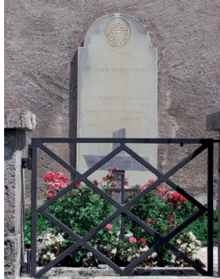
Rilkes Grab (links) bei der Pfarrkirche und der ältere Wohnturm der Burg Raron (rechts).

Tourismus Raron-Niedergesteln, Tel. 027 934 31 00, www.raron.ch