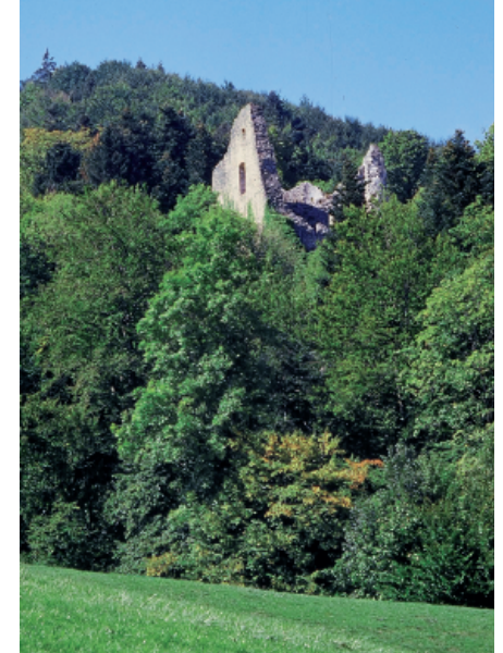
Vom Schlossgut (links) bis zur Ruine Löwenburg (rechts) ist es nicht weit.

Auf dem Plateau oben angekommen, rücken die Ruine und der Gutshof Löwenburg ins Blickfeld.