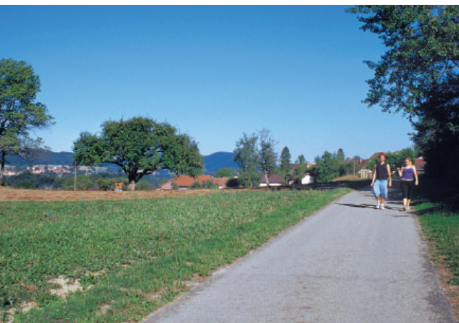
Nördlich von Ederswiler führt der Jura-Wanderweg bis unmittelbar an die französische Grenze.

Vom Bahnhof in Delémont fahren wir mit dem Postauto ins kleine, malerisch gelegene Dörfchen Roggenburg dicht an der französischen Grenze. Bei der Post steigen wir aus, und nach wenigen Schritten stehen